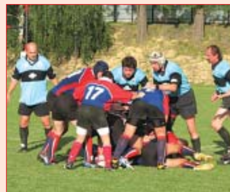
Utkání mužů TJ Sokol Mar. Hory – RC Pře-louč.