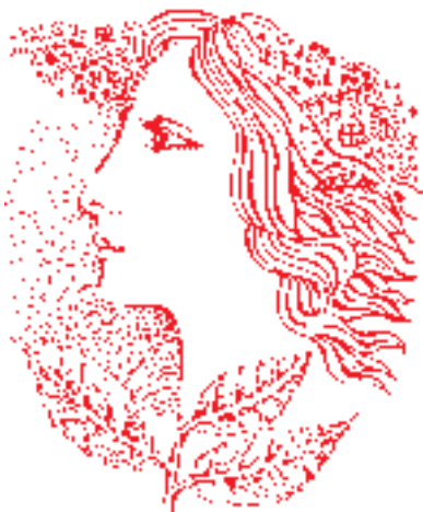
Léto – ilustroval Jindřich Oleš

ZDARMA DO KAŽDÉ DOMÁCNOSTI ● ČERVEN 2007/6